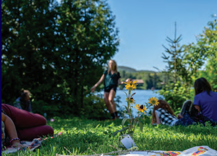
Interprètes sur la photo, de gauche à droite : Olivier Landry-Gagnon, Élise Bergeron, espace végétale Rudfactia